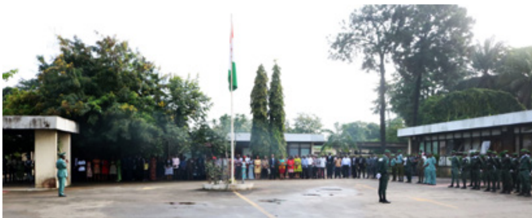
Salut aux couleurs