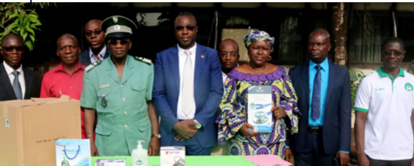
La cérémonie de remise de don de la Mutuelle Iroko des Agents de la SODEFOR (MIAS)

Le lundi 04 juin 2018, lors de la traditionnelle cérémonie de salut aux couleurs, qui se tient le 1er lundi de chaque mois, la Mutuelle Iroko des Agents de la SODEFOR (MIAS) a fait un don en équipements médicaux au Centre de Santé de l'Entreprise. Il s'agit de : 5 tensiomètres professionnels ; de 5 glucomètres professionnels ; 3 boîtes de bandelettes pour les glucomètres ; 3 boîtes d'aiguilles à usage unique ; un stéthoscope professionnel associé à un brassard à air comprimé ; 2 litres de gels stérilisants ; 2 boîtes de gants ; un paquet de coton hydrophile.