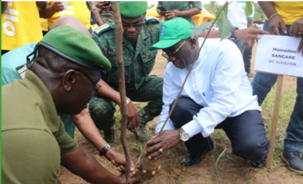
Plant d'arbres dans la forêt classée d'Anguededou avec le DG de la SODEFOR.

Dans la forêt classée d'Anguededou, située au nord d'Abidjan, MTN Côte d'Ivoire (MTN-CI) a procédé, le mardi 5 juin 2018, à un planting de 2100 arbres, suivi d'une randonnée à vélo pour marquer la Journée Mondiale de l'Environnement (JME). Cette politique de responsabilité sociale a été soutenue par le Ministère des Eaux et Forêts et la SODEFOR à travers leurs appuis techniques.